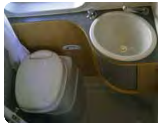
Der Sanitärraum ist klassenüblich ausreichend dimensioniert und gut ausgestattet.