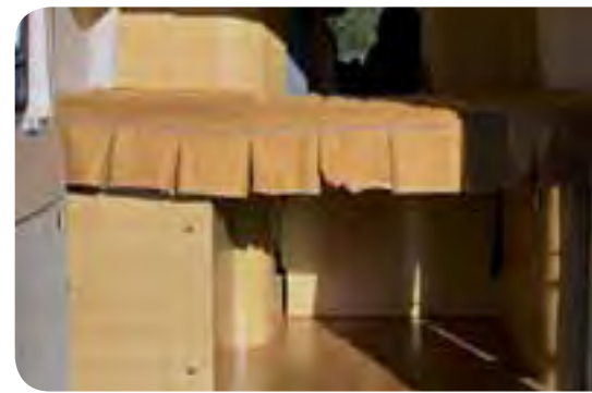
Riesiger Stauraum unter dem aufklappbaren Heckbett.