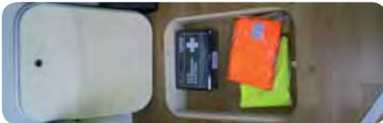
Platz im Podest unter der Sitzgruppe: Praktisches Staufach.

Fazit: Der neue Adria Twin auf dem langen Radstand hat deutlich an Raumgefühl und modernem Format gewonnen. Adria bietet mit dem Twin auf dem Fiat Ducato ein komplett ausgestattetes und komfortables Fahrzeug mit guter Serienausstattung an, das durch einen handwerklich soliden und schicken Ausbau sowie hohe Alltagstauglichkeit positiv überrascht hat. <<<