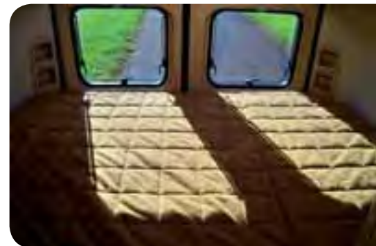
Das quer angelegte Heckbett überzeugt durch Größe und Schlafkomfort.