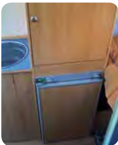
Kleiderschrank und Kühlschrank neben der Küche.

zung der Dusche noch den Durchgang zu Kühlschrank und dem Heckbett zulässt. Zusätzliche Ablagen im Duschaum sorgen für eine komfortable Unterbringung der Waschungensilien, den Wasservorrat hat man bei Adria nun um 20 Liter auf einen 110 Liter fassenden Frischwassertank erweitert. Den Heckbereich füllt das feste Doppelbett aus. Ausgestattet mit Federkernmatratze und Lattenrost bietet es genügend Platz und Komfort für zwei Erwachsene. Darunter befindet sich ein riesiger Stauraum mit Durchlademöglichkeit. Der Stauraum kann durch Anheben des Lattenrostes