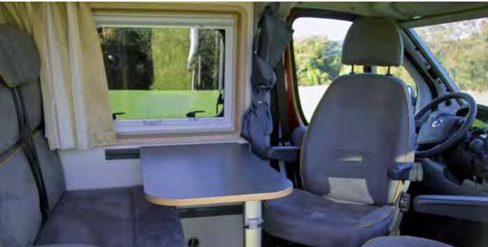
Auf neuer Basis optimiert: Der Wohnraum des Adria Twin.

tiv bemerkbar. Im Innenraum angekommen wird man vom Raumgefühl und dem neuen Möbel-Layout überrascht. Wie bisher befindet sich auf der linken Seite an der Schiebetür der Küchenblock. Hier hat Adria sein neues „Küchencenter“ installiert, das mit Rundspüle, Zweiflamm-Gaskocher sowie Besteckschublade und Schränken für die Koch- und Lebensmittelutensilien funktionell ausgestattet ist. Dahinter schließt sich der ausreichend große Kleiderschrank und darunter ein auf 70 Liter Volumen vergrößerter Absorberkühlschrank an. Unter der Sitzgruppe und im Durchstieg zum Fahrer-