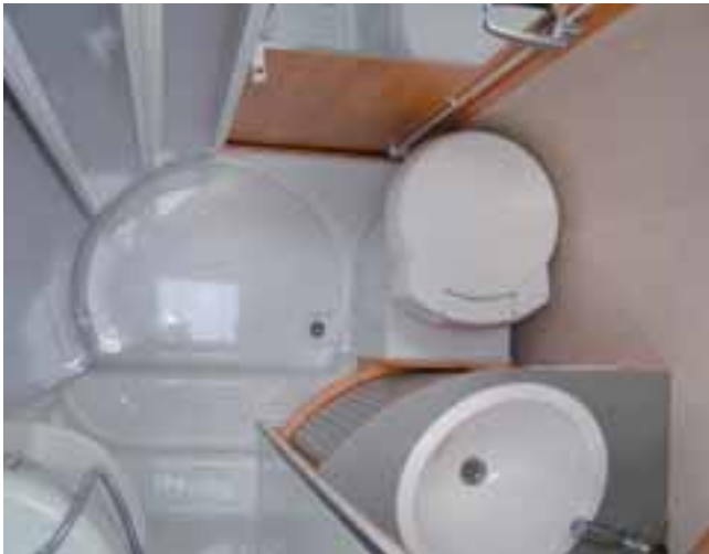
■ Das Bad im Zustand „Waschen und Toilette“ mit gefalteter Duschabtrennung.