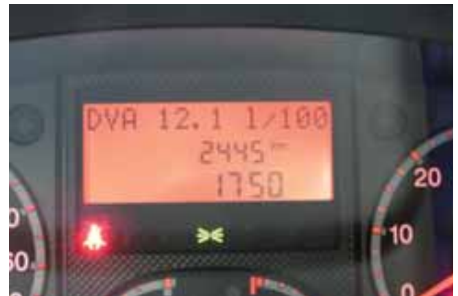
■ Test-Durchschnittsverbrauch 12,1 l / 100 km, in Anbetracht der gefahrenen Strecke ein akzeptabler Wert.

Text: Hans F. Schwarz