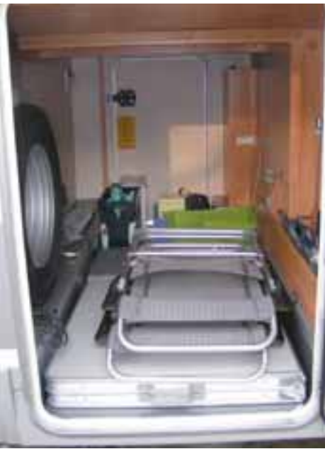
■ Die große Heckgarage unter den Einzelbetten bietet Platz im Überfluss. Seitliche Staufächer helfen, Ordnung zu halten.

chenkrepp-Vorrat und Unterlegen von Antirutschmatten werden sie dazu verdammt, vorne zu bleiben. Zu viel Platz ist nicht immer von Vorteil. Im Kühlschrank hat auf der Rückfahrt bestimmt alles Platz, was wir auf dem Einkaufszettel stehen haben, vom Olivenöl bis zu leckerem toskanischem Käse. Der Karton Chianti Classico kommt zu gegebener Zeit in die große Heckgarage und teilt sich dort den Platz mit der Sitzgarnitur und dem großen Campingtisch, der Mineralwas-