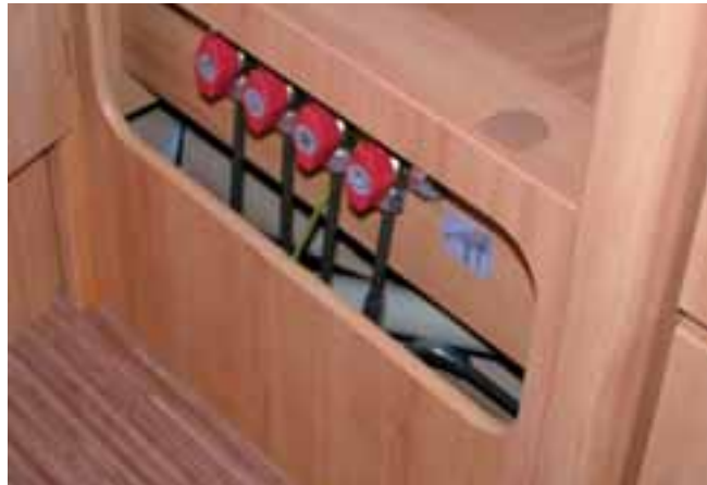
■ Im Unterteil des Kleiderschranks sind die Gasabsperrventile gut zugänglich und doch geschützt.

denswasser im Innenraum vermieden. Der Kühlschrank im Rücken ist dank einem leichten Sockel gut zu erreichen, auch der darüber liegende Gasbackofen von SME bereitet in der Zugänglichkeit keine Probleme. So sind die Frühstücksbrötchen oder auch mehr einfach aufzubacken. Über der Küche ragt aus der Front der Hängeschränke der Fernsehschrank hervor, verbirgt seinen im Testwagen nicht vorhandenen, aber auch zu kleiner Zeit vermissten Inhalt hinter einem Rollladen. Eingebaut