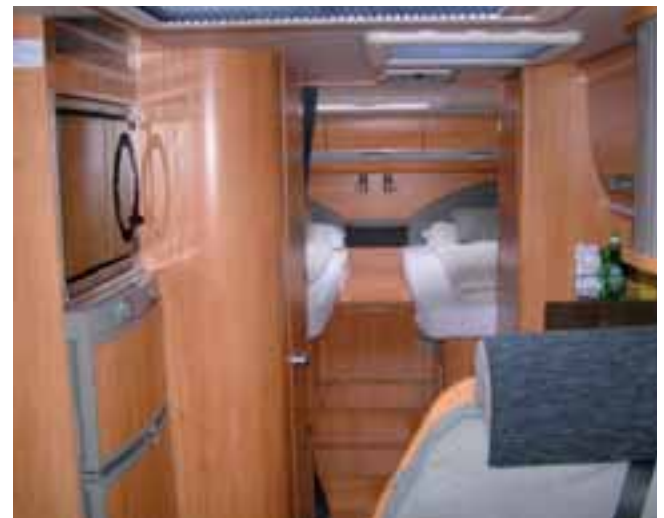
■ Das Schlafzimmer mit Einzelbetten über der Heckgarage, zugänglich über eine bequeme Treppe.

Unser Außenrundgang ist beendet, durch die tief angesetzte Auftaktür klettern wir nach innen. Klettern ist hier jedoch der falsche Ausdruck, die innenliegende Stufe erspart uns dies, außerdem entfällt das oft lästige Ein- und Ausfahren einer im Dreckbereich außen liegenden Trittstufe. Wir sind so-