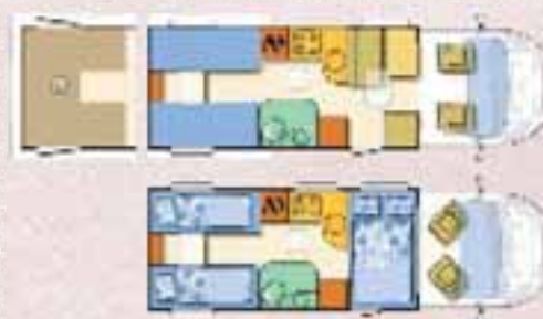
■ Grundriss Adria Coral S 670 SL.