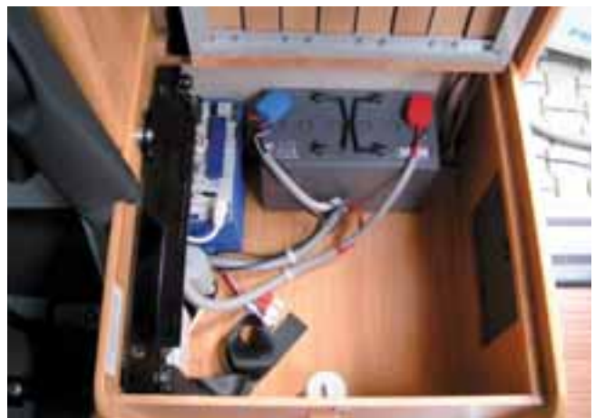
■ Im Unterbau des Seitensitzes sitzt gut zugänglich die Elektrozentrale mit dem Bordakku.

Die Sitzgruppe im vorderen Teil des Wagens verspricht gemütliches Sitzen in der Runde. Die Halbdinette aus Zweierbank mit sitzgerecht ausgeformten Polstern und durchgehender Kopfstütze, unter der die Dreipunktgurte angeleitet sind, den Drehsesseln des Fahrerhauses und dem geheimnisvollen Seitensitz gruppiert sich um den stabilen Einbeintisch, der durch eine Ausziehplatte bis zum Seitensitz vergrößert werden kann. Der Einzelsitz an der rechten Seite kann durch Umstecken des Rohrgestells der Rückenlehne zum Sitz gegen die Fahrtrichtung umgebaut werden. Der Passagier sitzt dann, mit Beckengurt gesichert und mit den Füßen auf der Fußstütze, mit Blick auf den Kühlschrank und die Heckeinrichtung, ein Not-sitz also, wenn auch nicht un-