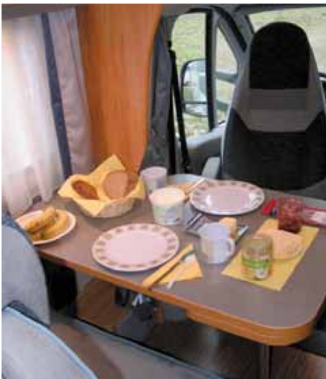
■ Halbdinette, drehbare Fahrerhaussitze und Seitensitz ergänzen sich zu einer gemütlichen Runde um den Tisch.

fort vertraut mit dem Charme des Mollebusch-Mobiliars, ein vertrauter Holzton bei Adria. Er harmoniert in seinem hellbraunen Ton mit jeder Außenfarbe, ist weder kalt noch zu dunkel, gefällt eigentlich fast Jedem, egal ob jung oder alt. Dazu die zweifarbig grauen Polsterbezüge bis hin zu den Fahrerhaussitzen, abgesetzt durch ein Material, das Alcantara täuschend ähnlich sieht, aber keines ist. Aus Erfahrung wissen wir heute, dass sich Flecken daraus ohne Probleme entfernen lassen, ein feuchtes Mikrofaser-tuch reicht aus.