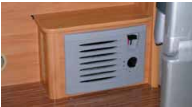
■ Im Luxuspaket enthalten ist ein zusätzlicher Wärmetauscher der Fahrzeugheizung im Wohnraum, gut für Fahrten zum Wintercamping.

bequem. Umso bequemer dagegen die Sitze im Führerhaus, Adria-Komfortsitze nennen sich die Möbel, haben die gleichen Bezüge wie die Wohnraumsitze, Armlehnen und leichtgängige Lehnenverstellung. Ihre Drehsockel sind so flach, dass der Blick durch die Windschutzscheibe auch für über 180 cm große Urlauber nicht getrübt wird.