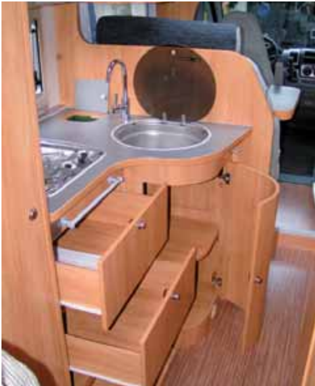
■ Viel Stauraum und leicht zu erreichen: Die Küche bietet keinen Anlass zur Klage und hat sich ringsum bewährt.