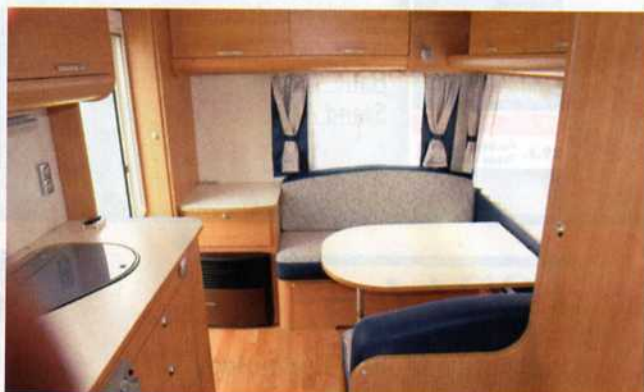
■ Die Sitzgruppe seitlich im Heck bietet ordentlichen Sitzkomfort.

me, AKS und Kombirollen an allen Fenstern. Mit dann rund 12.900,- Euro rangiert der Adria aber immer noch knapp vor seinen direkten Konkurrenten aus Nord- und Süddeutschland. Für das im Testcaravan enthaltene Safety-Paket mit Alu-Felgen, Ersatzrad auf Stahlfelge und rollbaren Abwassertank verlangt Adria einen Zuschlag von 399,- Euro.