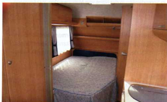
■ Längs gestelltes Bugbett mit noch ausreichend großer Liegefläche.