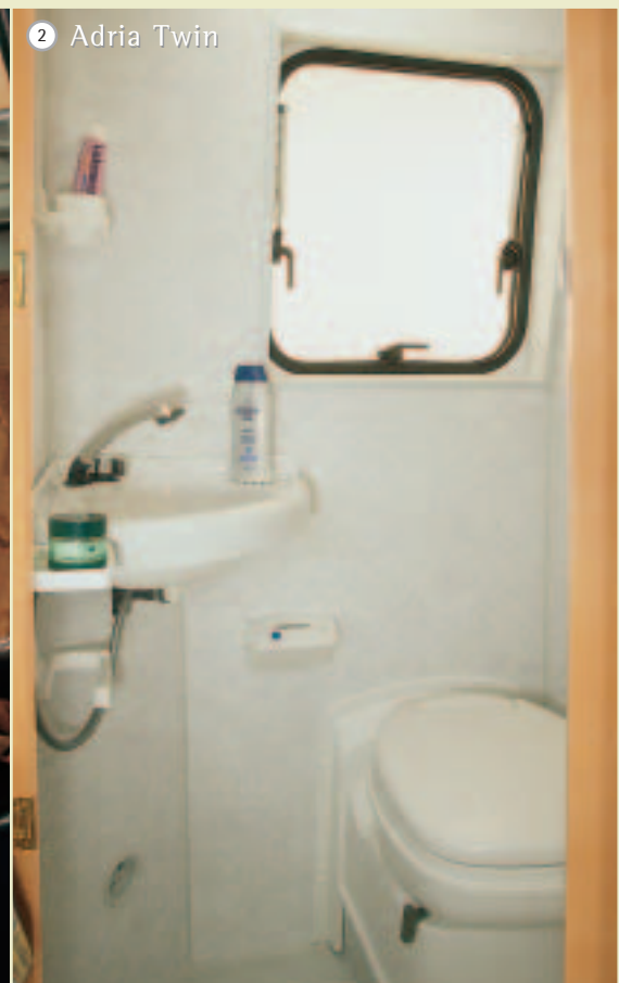
2 Adria Twin