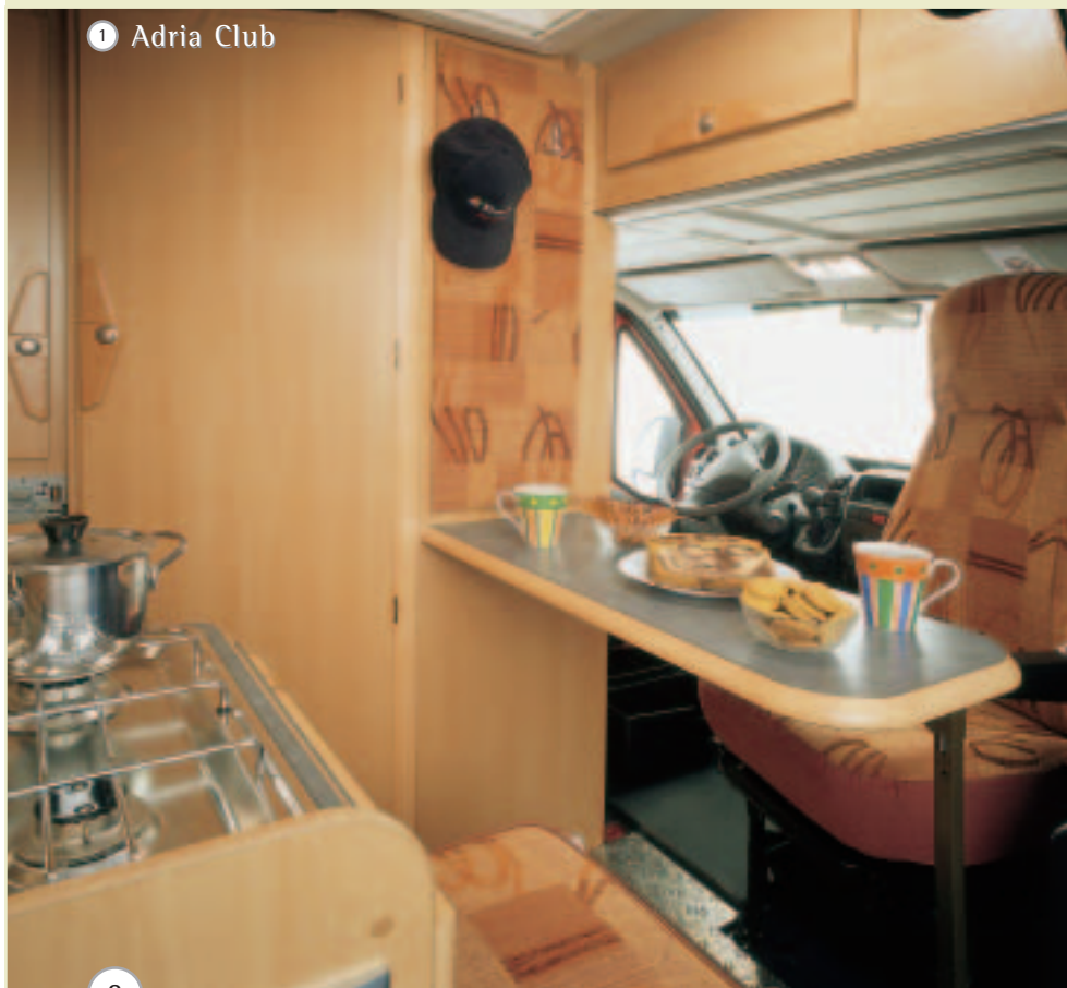
1 Adria Club